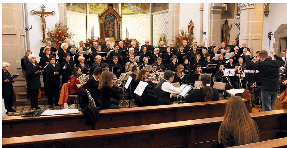
Das Konzert zum Jubiläum des Chores Cäcilia wurde zum Erlebnis für alle Akteure und Gäste.

Den Patienten sei nicht bewusst, dass sie noch immer an einer chronischen Herzerkrankung leiden und deshalb ihren Lebensstil ändern und auf Dauer ihre Medikamente einnehmen müssen. Hier bestehe großer Aufklärungsbedarf. red